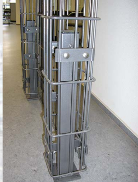
Befestigung der Ranksäule am Bodenanker