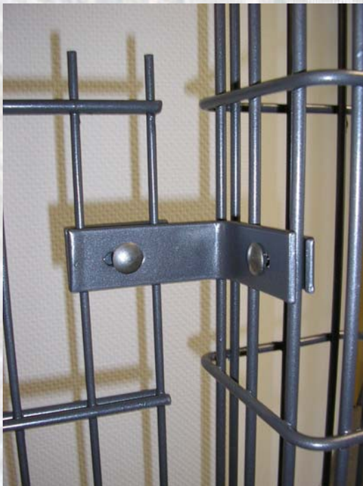
Befestigung der Gittermatte an der Ranksäule mit Abstandshalter für Rankgitter und Gitterlaschen